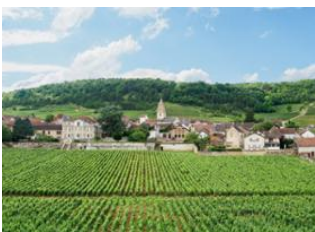
Le Domaine des Aubineaux 📍